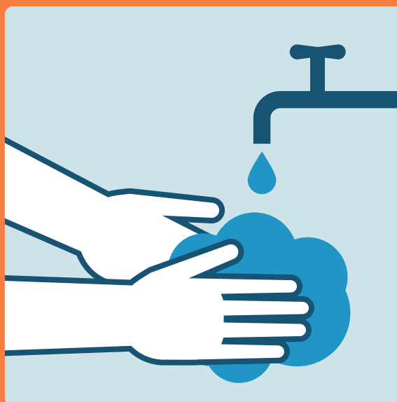
Lavarsi le mani