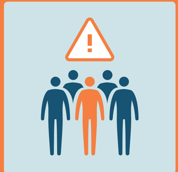
Evitare luoghi affollati