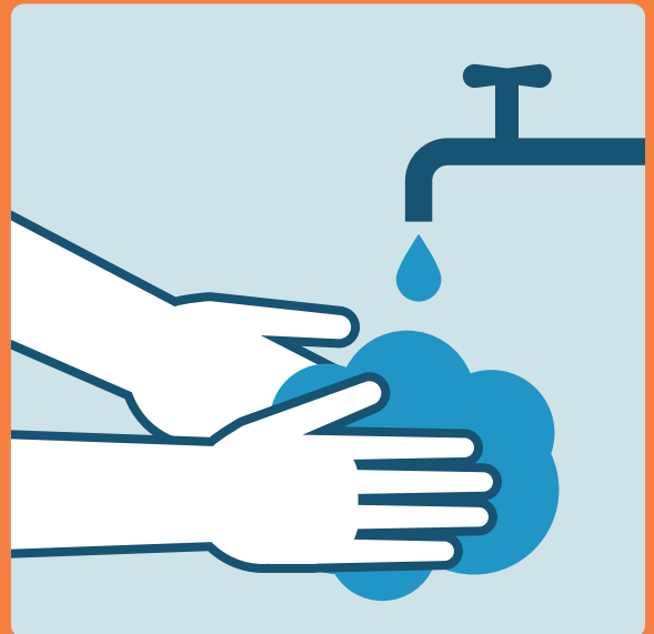
Lavarsi le mani