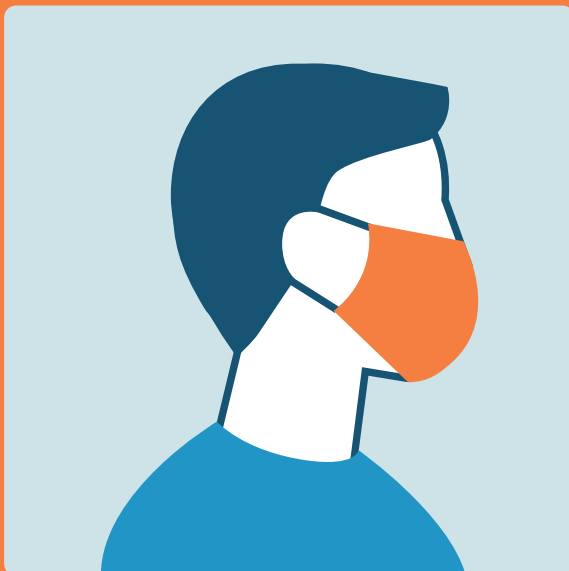
Usare la mascherina